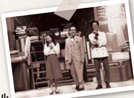
サミュエル (隣のチョコレート屋)

国立音楽大学声楽科を経て、日劇ダンシングチーム入団。退団後は、「王様と私」「シカゴ」「真夏の夜の夢」「SEMPO」等のミュージカルを中心にストリートプレイ、コンサート、レヴュー、ナレーション等幅広く活動中。