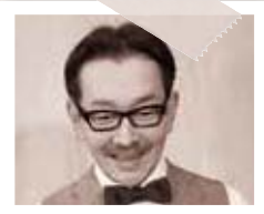
ヴィクター (本屋の前の前のオーナー)

1988年宝塚歌劇団入団。1991年月組トップ娘役に就任。1995年「ミー・アード・マイガール」を最後に退団。その後、舞台・テレビドラマ・映画等幅広く活躍。「シンデレラ」「水戸黄門」「愛の110番」「十二夜」「わが町」等。